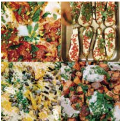
Dæmi um rétti sem í boði eru í mötuneyti starfsfólks MA

Menntaskólinn á Akureyri er þátttakandi í verkefninu en á heimasíðu verkefnisins, er athygli vakin á grænum skrefum mötuneytis starfsfólks MA en stór hluti verkefnisins snýr einmitt að fæði starfsfólks. „Við getum haft mikil áhrif á kolefnisspor okkar með vali á fæðutegundum og með því að sporna gegn matarsóun. Meðal þess sem Grænu skrefin leggja til er að auka úrval grænkerarétta, hafa umhverfisvænasta réttinn efst á matseðli (þegar fleiri en einn eru í boði) og að auka hlutfall lífræna matvæla á matseðli,“ segir á heimasíðu Grænu skrefanna.