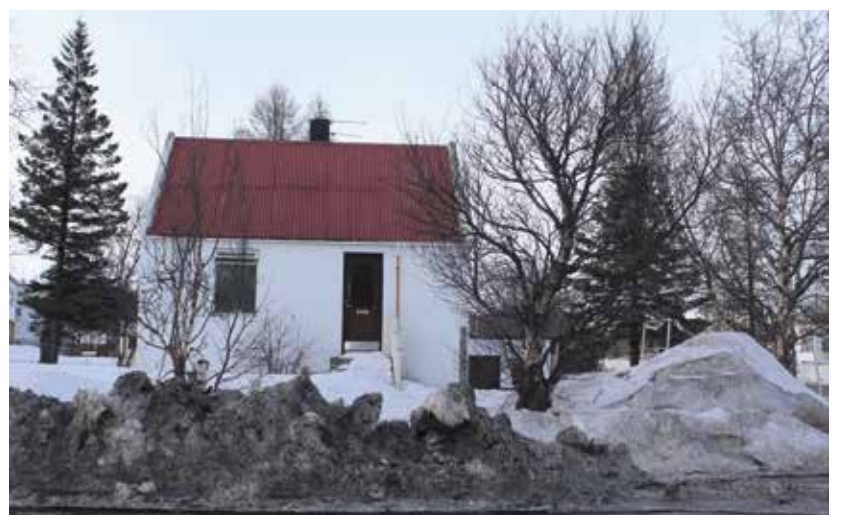
Húsið við Höfðahlíð 2, Barð eins og það hét í eina tíð verður rífið og er heimilt að byggja fjögurra til fimm íbúða hús á lóðinni. Fimm sóttu um lóðina.

Samkvæmt gildandi skipulagi er heimilt að fjarlægja núverandi hús af lóðinni og samþykkt hefur verið tillaga um að heimilt sé að byggja á lóðinni hús með fjórum íbúðum.