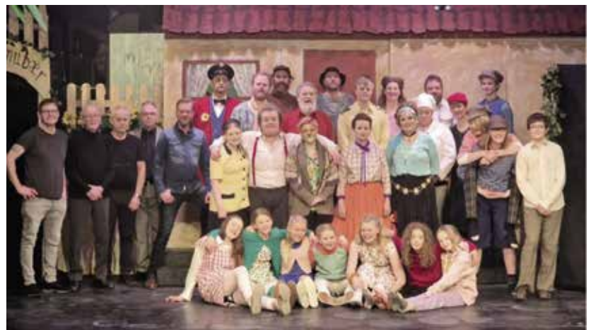
Aðstandendur sýningarinnar að lokinni frumsýningu.