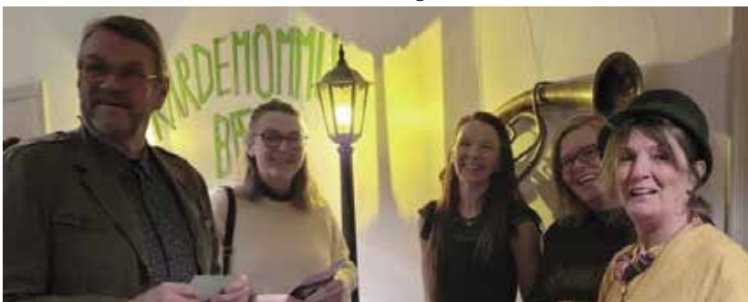
Það var hátíðleg stund þegar Freyvangsleikhúsið frumsýndi Kardemommubæinn um liðna helgi. Frumsýningagestir og aðstandendur sýningarinnar brostu út að eyrum.

Sýningin er afar metnaðarfull en alls taka 26 leikarar taka þátt í uppsetningunni. „Við erum með hljómsveit og svo erum við með alla hina. Ég held að við séum að lágmarki 60 manns sem komum