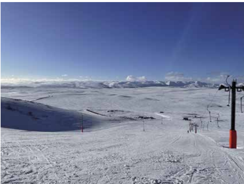
Skíðasvæði Húsavíkur er nú uppá Reykjaheiði við Reyðarárhnjúk. Lyftan sem áður var í Skálamel var flutt og opnuð formlega þann 28. desember 2019. Skíðavæðið er sannkölluð náttúruperla með og hentar ákaflega vel fyrir fjölskylduna að eyða deginum á skíðum með börnunum. Blíðskaparveður var um síðustu helgi á svæðinu þegar Karl Hreiðarsson tók þessa mynd