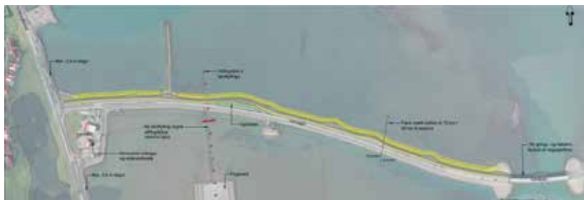
Til stendur að leggja nýja göngu- og hjólastíg meðfram Leiruvegi, frá Drottningarbraut og austur að Leirubru. Hann verður tvískiptur, annar fyrir gangandi og hinn hjólandi. Undirbúningur stendur sem hæst en þess er vænt að verkinu verði lokið sumarið 2023.

Eyjafjarðarsveit sér um gerð stígs austan við nýju brúna með tengingu við Skógarböðin. Hugmyndir eru um að koma fyrir