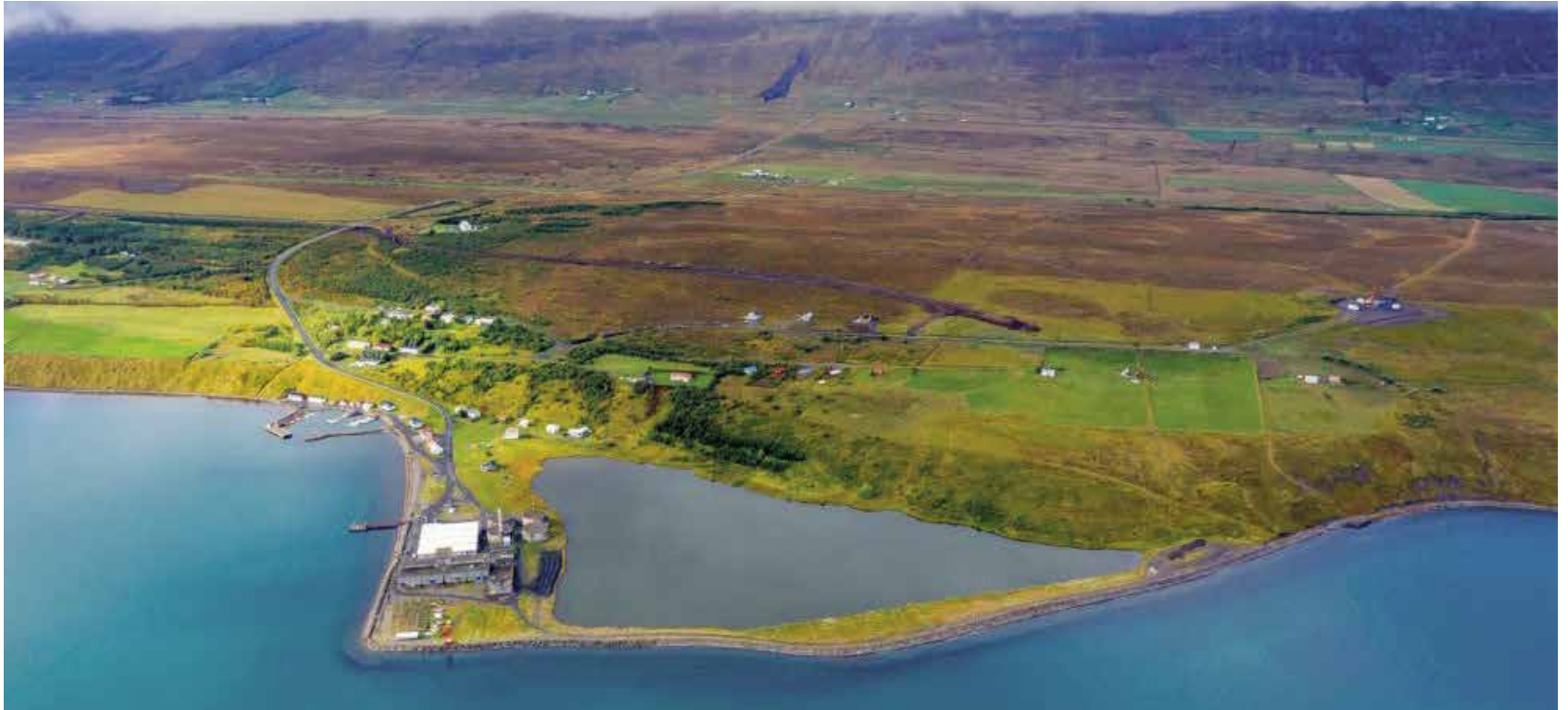
Hjalteyri - Lagning aðveitueðar til Akureyrar í ágúst 2019.

-Heitavatnsnotkun á Akureyri hefur tvöfaldast á 20 árum, langt umfram fólksfjölgun